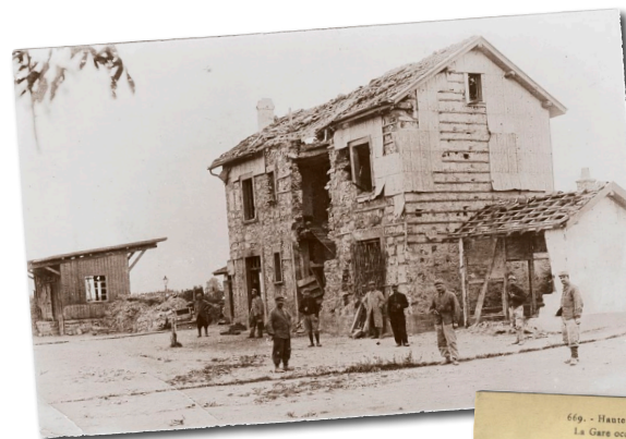
A gauche: le bâtiment voyageurs d'origine EST malmené par les combats de 1914, tout comme celui de Burnhaupt ci-dessous qui faisait face à une tranchée côté voies. Il reste un bâtiment de ce type sur la ligne: Guewenheim.